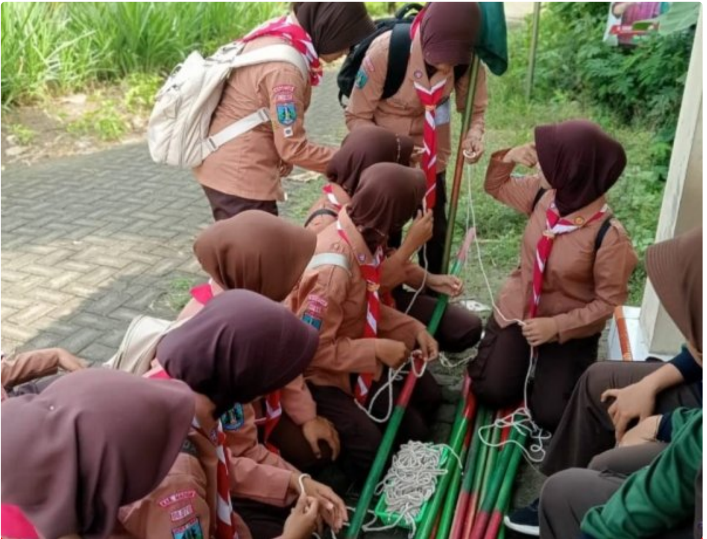
Saka Wira Kartika Koramil 0804/08 Barat Gelar Penjelajahan Dalam Penempuhan SKK

Magetan. - Saka Wira Kartika Koramil Tipe B 0804/08 Barat menggelar kegiatan penjelajahan penempuhan SKK di wilayah Koramil Tipe B 0804/08 Barat dan sekitarnya. Kegiatan ini bertujuan untuk memperkuat jiwa kepemimpinan, kedisiplinan, serta semangat cinta tanah air di kalangan peserta. Selasa (10/12/2024)