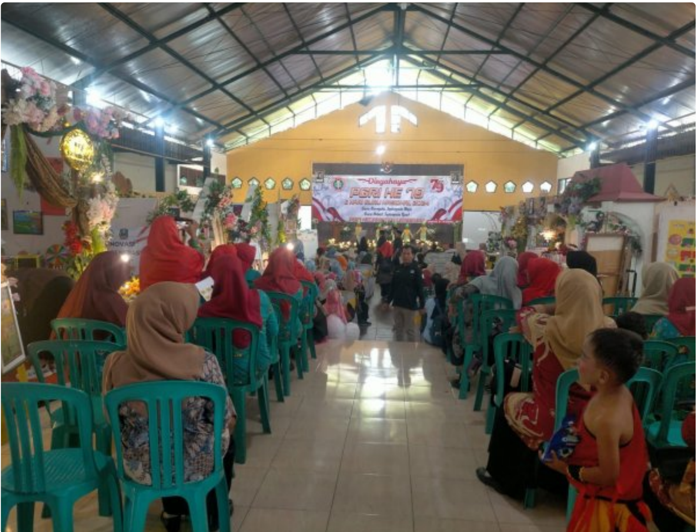
Danramil 0804/12 Lembeyan Hadiri HUT PGRI Ke-79 Dan Hari Guru Nasional (HGN) Se Kecamatan Lembeyan Tahun 2024