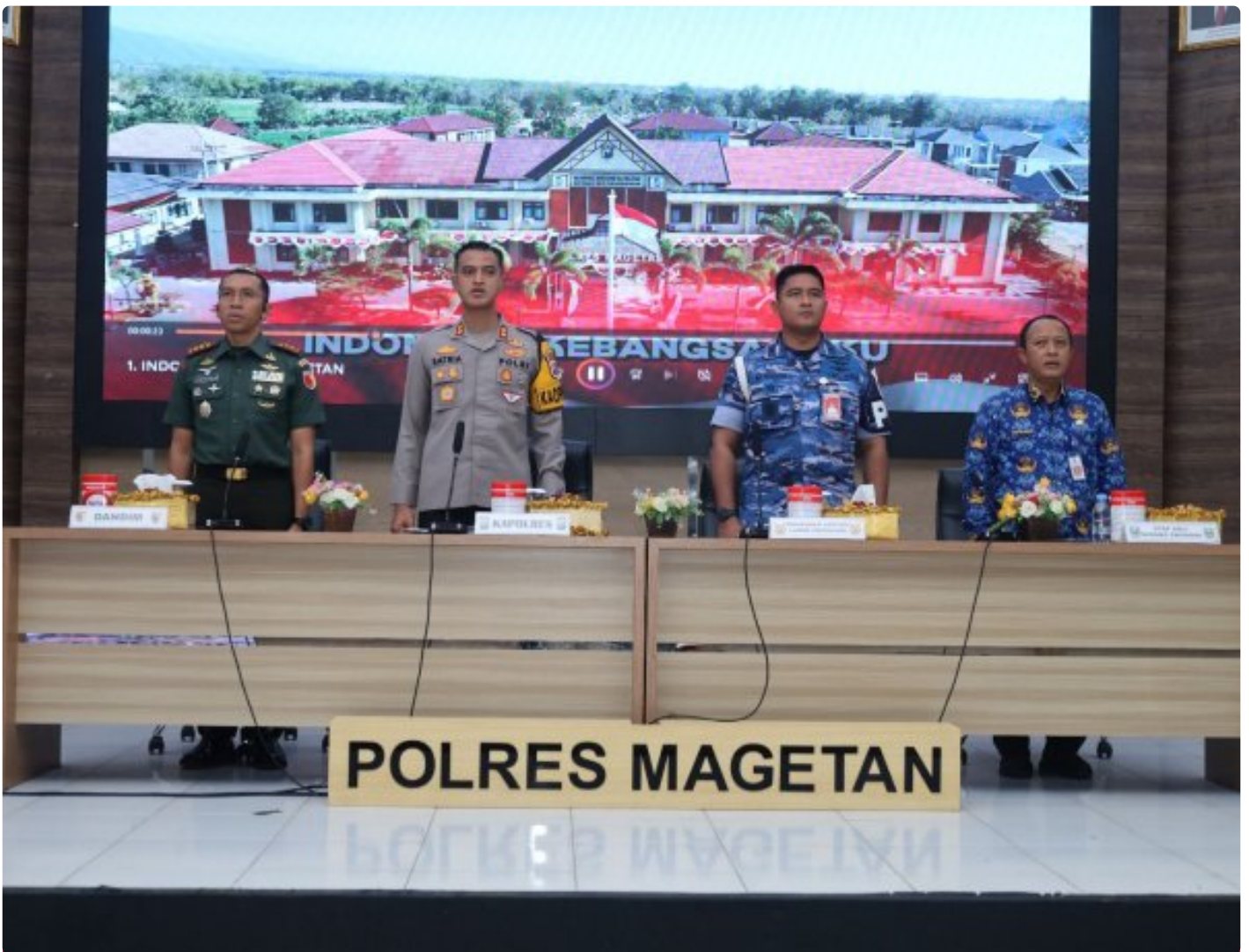
Dandim 0804/Magetan Hadiri Rakor Lintas Sektoral kesiapan operasi lilin 2024

Magetan. – Guna meningkatkan Sinergitas dalam rangka kesiapan operasi lilin 2024 pengamanan Hari Raya Natal 2024 dan Tahun Baru 2025 di wilayah Kabupaten Magetan yang aman dan kondusif.